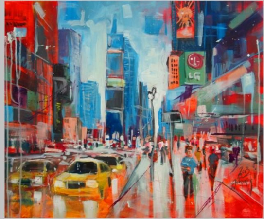
Canal Grande, Venezia akryl na płótnie, 70x70