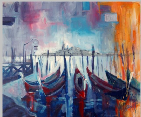
Venezia Gondola akryl na płótnie, 50x 60