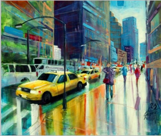
Times Square 2 akryl na płótnie, 70x60