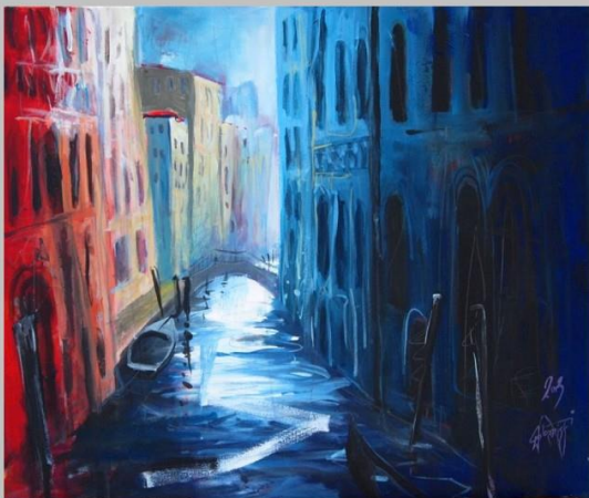
Wenecja widziana z dzwonnicy przy bazylice św. Marka akryl na płótnie, 50x70